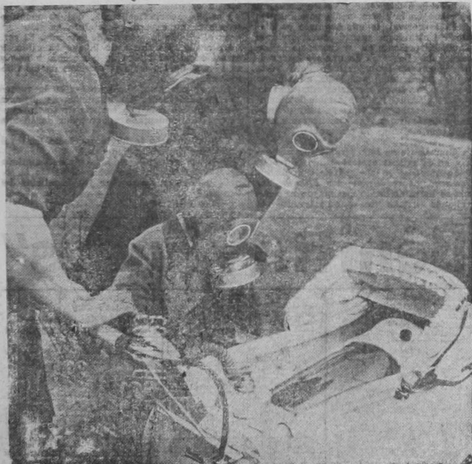
EN BERLIN, y ante el espectro de la guerra, el gobierno ha ordenado prácticas a los habitantes de la ciudad sobre el uso de máscaras contra los gases y hasta los cochecitos para pasear a los niños se han acondicionado con esas máscaras protectoras.

Esta reunión, como puede verse, tiene gran trascendencia ya que Costa Rica, como todos los otros países de América, y principalmente los pequeños, sería seriamente afectada por la terrible crisis económica y financiera que habría de producirse si las gestiones que se realizan para mantener la paz no llegaran, desgraciadamente, a obtener buen resultado. Ya otras naciones han actuado previsoramente en este sentido, estableciendo determinadas restricciones comerciales y fiscales para poder hacer frente a tal crisis, y aquí mismo se ha venido considerando en el gobierno la necesidad de proceder sin demora en ese sentido. Creemos, pues, que nuestros lectores recibirán con complacencia esta noticia, que viene a indicar que nuestro gobierno ha resuelto aconsejarse de quienes entienden de la materia para proceder como sea oportuno en el caso a que nos referimos, de que sea declarada la guerra en Europa.